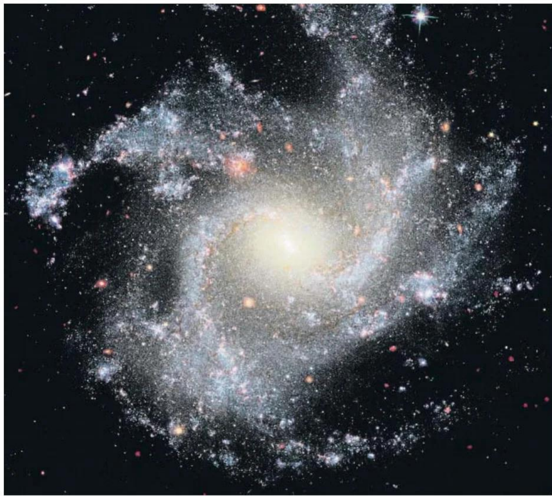
La galaxia NGC 5468, la más lejana en que el Hubble ha identificado estrellas variables cefeidas

Se pensaba que esta discrepancia podía ser debida a imprecisiones en los cálculos de la expansión del universo. Por ello, se esperaba que las observaciones de alta precisión del telescopio espacial James Webb, que entró en servicio en el 2022, resolvieran el entuerto. Pero, en lugar de resolverlo, han confirmado que la velocidad de expansión del universo cercano es diferente a la del universo más lejano, algo para lo que las teorías cosmológicas no tienen explicación.