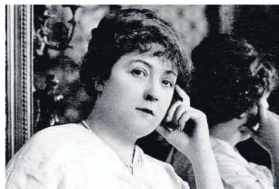
Henriette Caillaux, amante y luego esposa del ministro de Finanzas, asesinó al director de Le Figaro