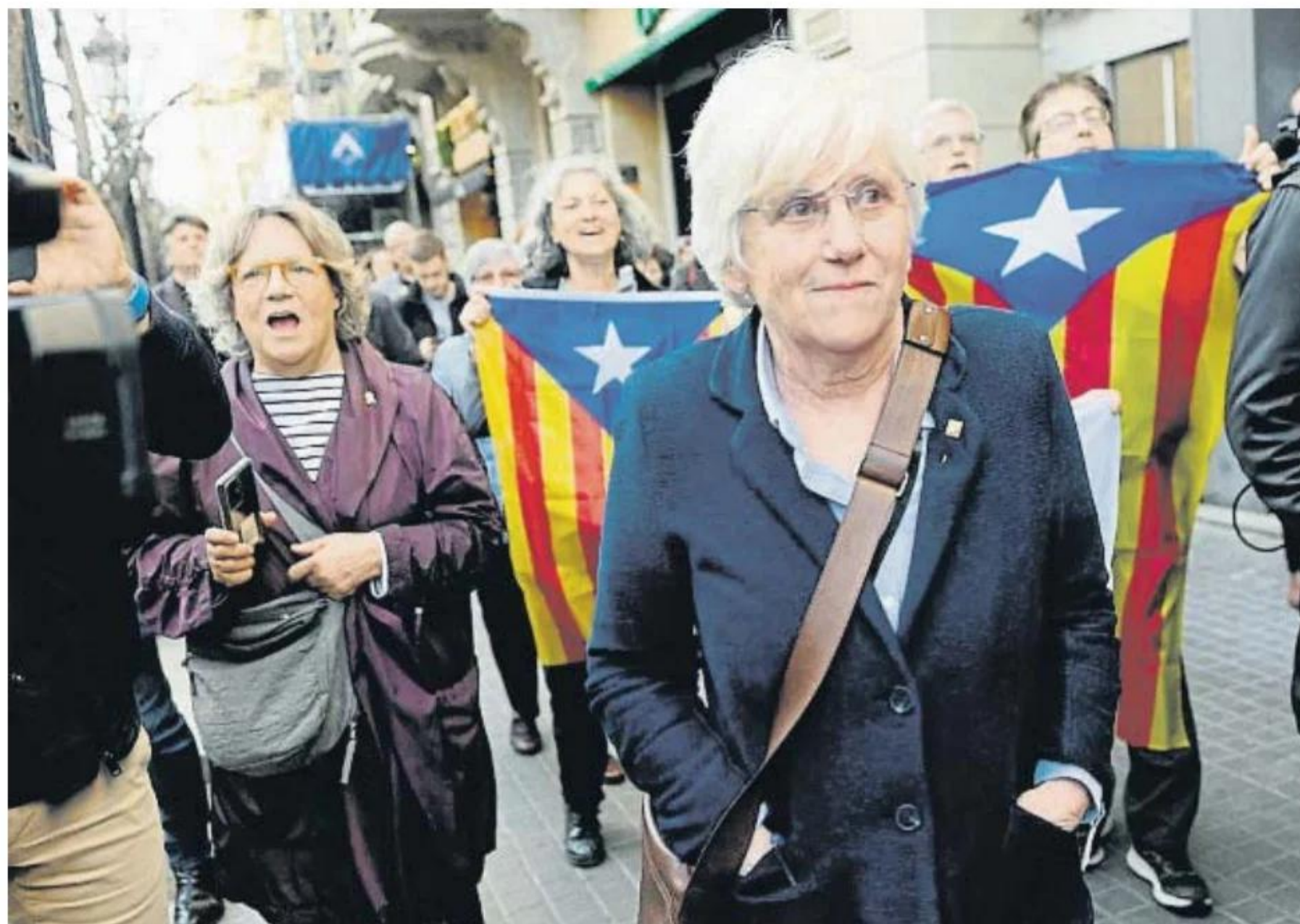
La eurodiputada Clara Ponsatí, hace un año cuando volvió a Barcelona por primera vez

Teniendo en cuenta el escenario, JxCat acusa a socialistas y republicanos de adelantar las elecciones para descolocar a Puigdemont, que había previsto su retorno para otoño si la aplicación de la amnistía iba bien. ●