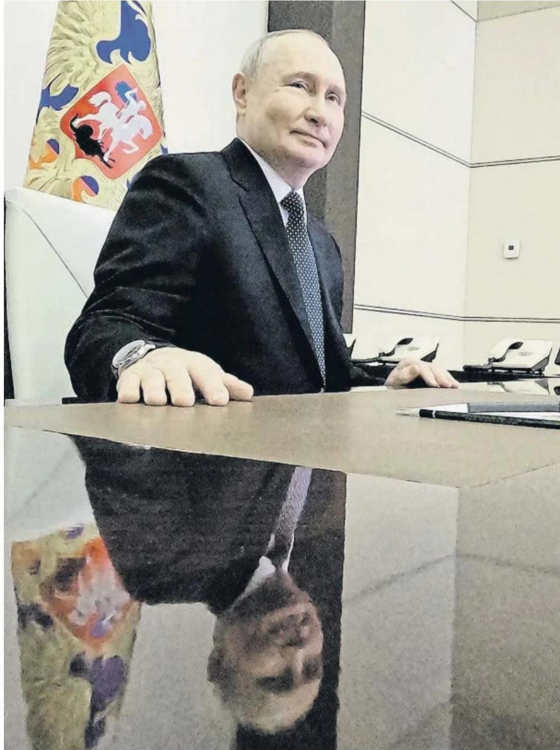
Vladímir Putin, en su residencia de Novo-Ogariovo mientras votaba ayer electrónicamente

Una de las incógnitas de estos comicios es qué efecto tendrá la iniciativa "Mediodía contra Putin" que ha lanzado desde el exilio el equipo del líder opositor Alexéi Navalni, fallecido el mes pasado en una prisión ártica. Sus excolaboradores y su viuda, Yulia Navál-