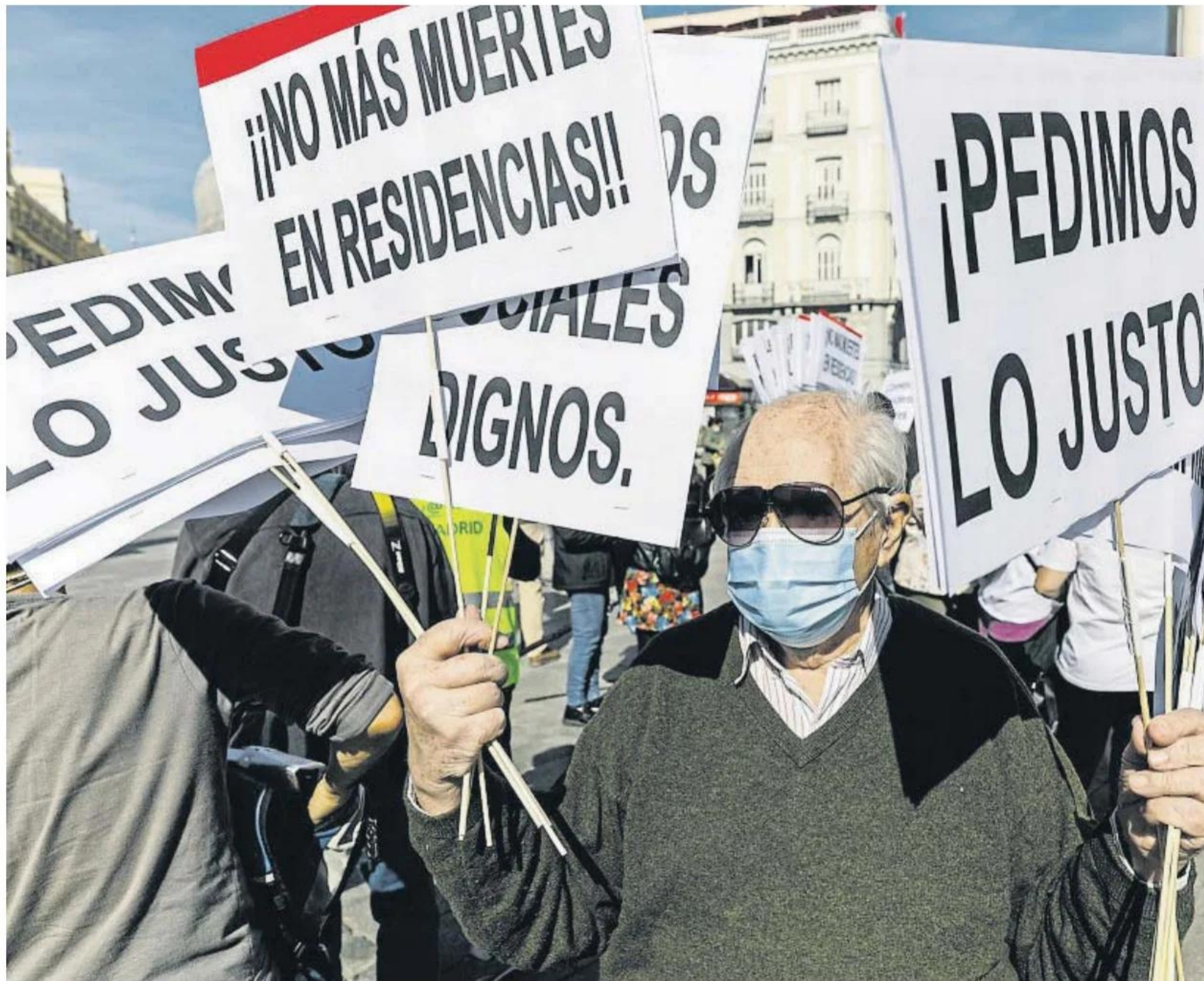
Los familiares de los residentes de los geriátricos de Madrid no han cesado de pedir justicia por lo ocurrido a principios del 2020

A cambio se prometía que las residencias iban a ser medicalizadas (lo ordenó el Tribunal Superior de Justicia de Madrid). Pero la realidad es que nunca lo fueron y los residentes murieron en esos espacios de la manera "horrorosa" que relató la mencionada trabajadora. Sus cuerpos aparecieron en las habitaciones y por distintas estancias de las residencias, relata el informe.