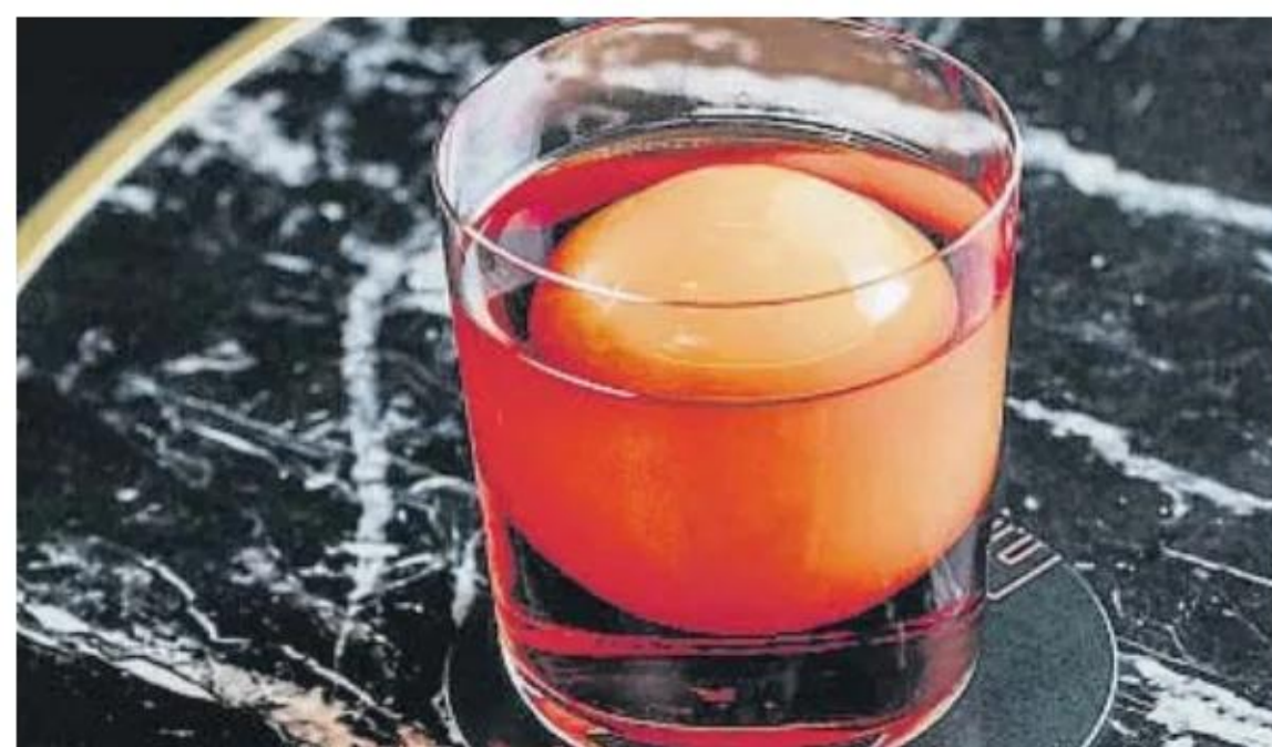
Uno de los cócteles que preparan en el barcelonés Sips

participarán en esta cita, que tendrá dos formatos principales: por un lado, los BBS Days, con los que el propio establecimiento ofrecerá un cóctel especial que le represente bajo la etiqueta BBS. De este modo se podrán seguir rutas por la ciudad, extendiendo las posibilidades de visita prácticamente a todos los distritos.