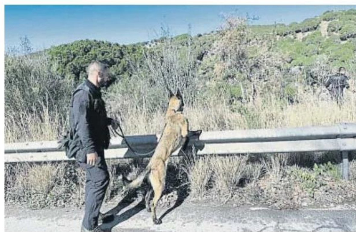
Un mosso de la canina rastrea los alrededores de Can Ruti

Precisamente los mossos de la unidad central de personas desaparecidas comunicaron hace dos