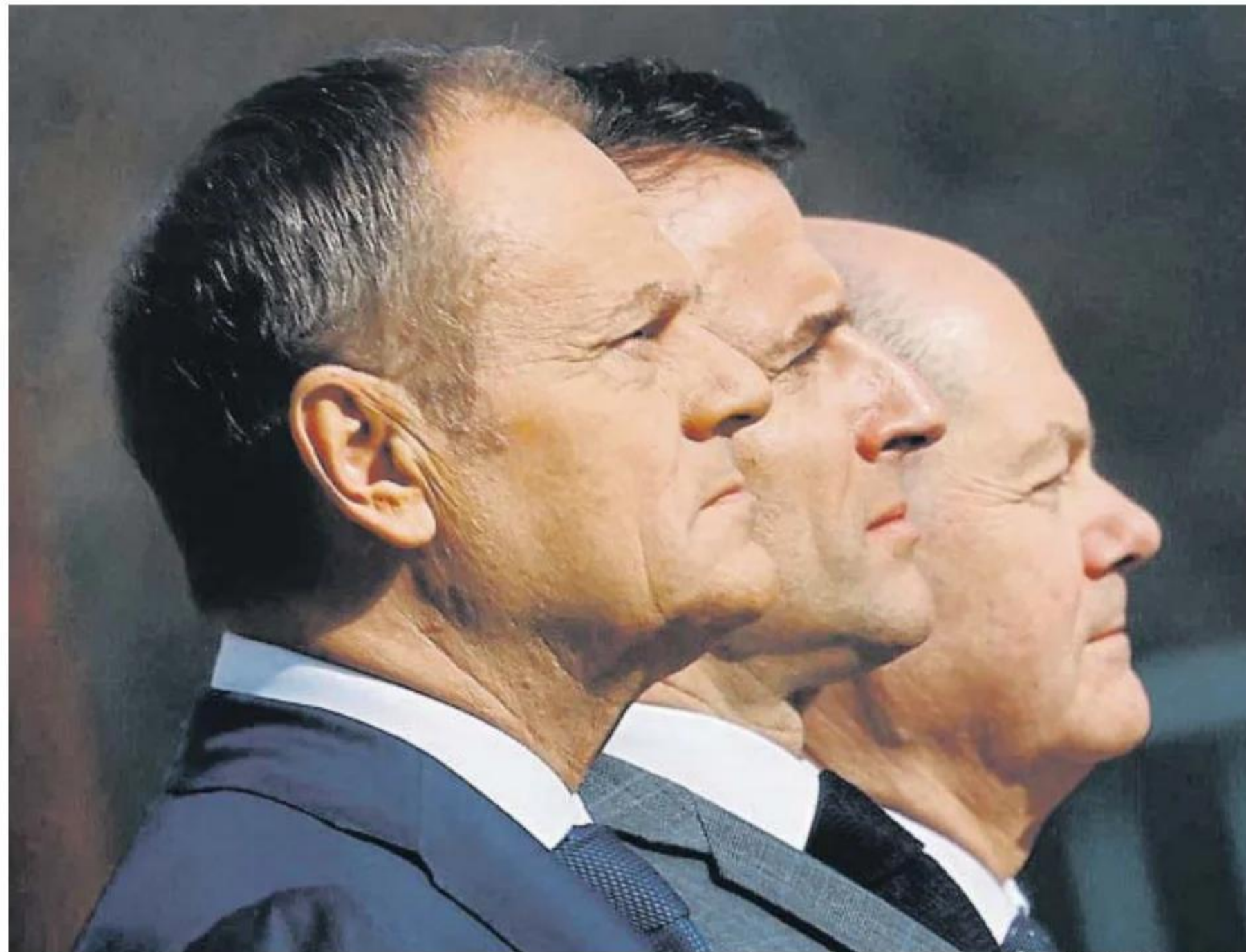
Donald Tusk, Emmanuel Macron y Olaf Scholz, ante la guardia de honor ayer en la Cancillería en Berlín

El Bundestag (Cámara Baja del Parlamento alemán) votó anteayer contra el suministro a Kyiv de misiles de crucero Tau-