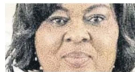
Rose Mutombo Ministra de Justicia del Congo

El Gobierno de la República Democrática del Congo ha reinstaurado la pena de muerte, acabando así con la moratoria sobre la ejecución de la pena capital iniciada en el 2003. / P. 6