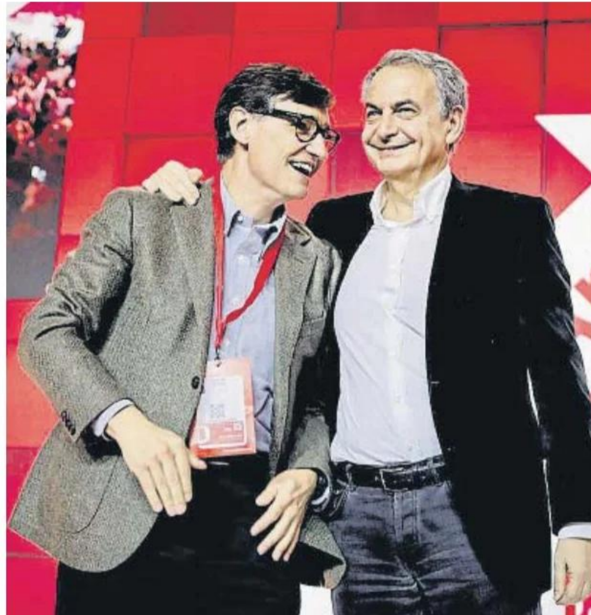
Salvador Illa y el expresidente Zapatero, en el congreso del PSC

En esta tarea, Illa dijo haber logrado que el PSC se haya erigido en una seria alternativa a "diez años perdidos, de dar vueltas a la misma idea, de vaivenes para aca-