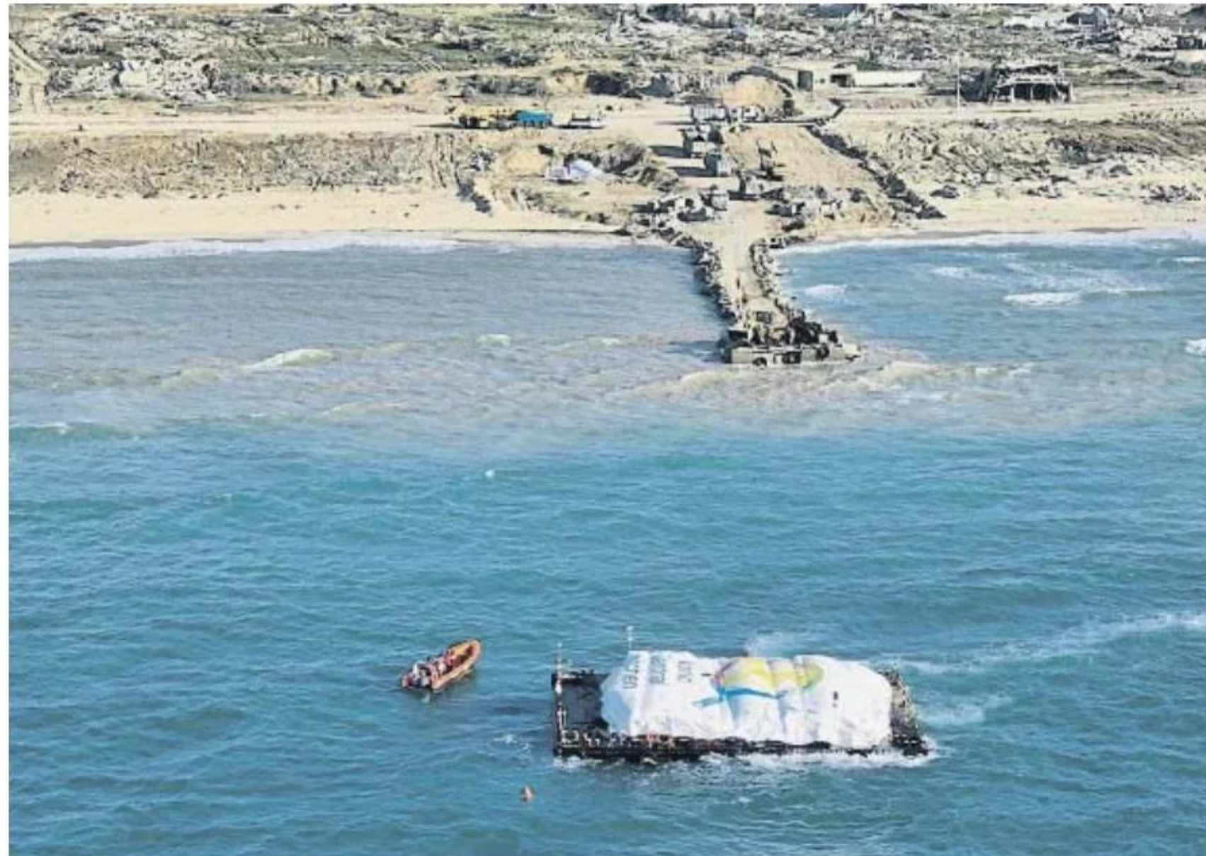
La gabarra con la carga y una de las lanchas del Open Arms, ayer delante del espigón

Entre 250.000 y 300.000 personas sobreviven en el norte de la franja como pueden, mientras que un millón y medio se concentra en el sur, en Rafah. La oficina del primer ministro israelí, Benjamin Netanyahu, anunció ayer que este “aprobó los planes