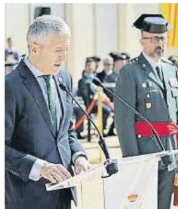
Marlaska y Pizarro