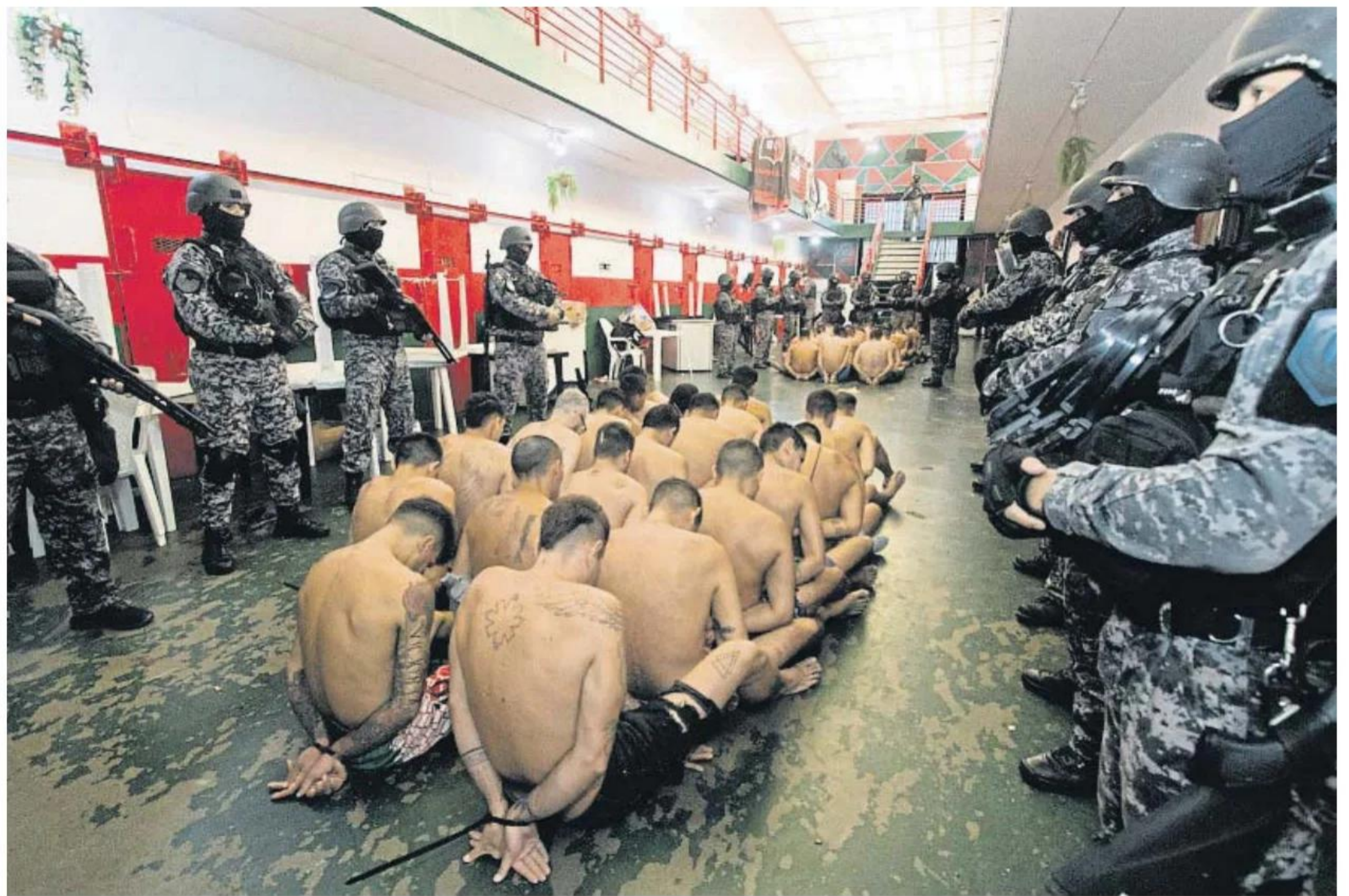
Requisita al estilo Bukele en la cárcel de Piñero (Santa Fe) el pasado 5 de marzo, el día anterior al inicio de la represalia narco

Hace más de una década que el narcotráfico empezó a tomar el control de la ciudad, que se disputan una treintena de bandas, ahora unidas en su pulso al Estado, la más importante de las cuales es Los Monos. Bandas que operan localmente, pero que también están al servicio de los cárteles mexicanos y colombianos, que usan la hidrovía desde Paraguay al Atlántico por el río Paraná y sus puertos -que constituyen el nodo agroexportador más grande del mundo- para sacar la droga con destino a África y Europa.●