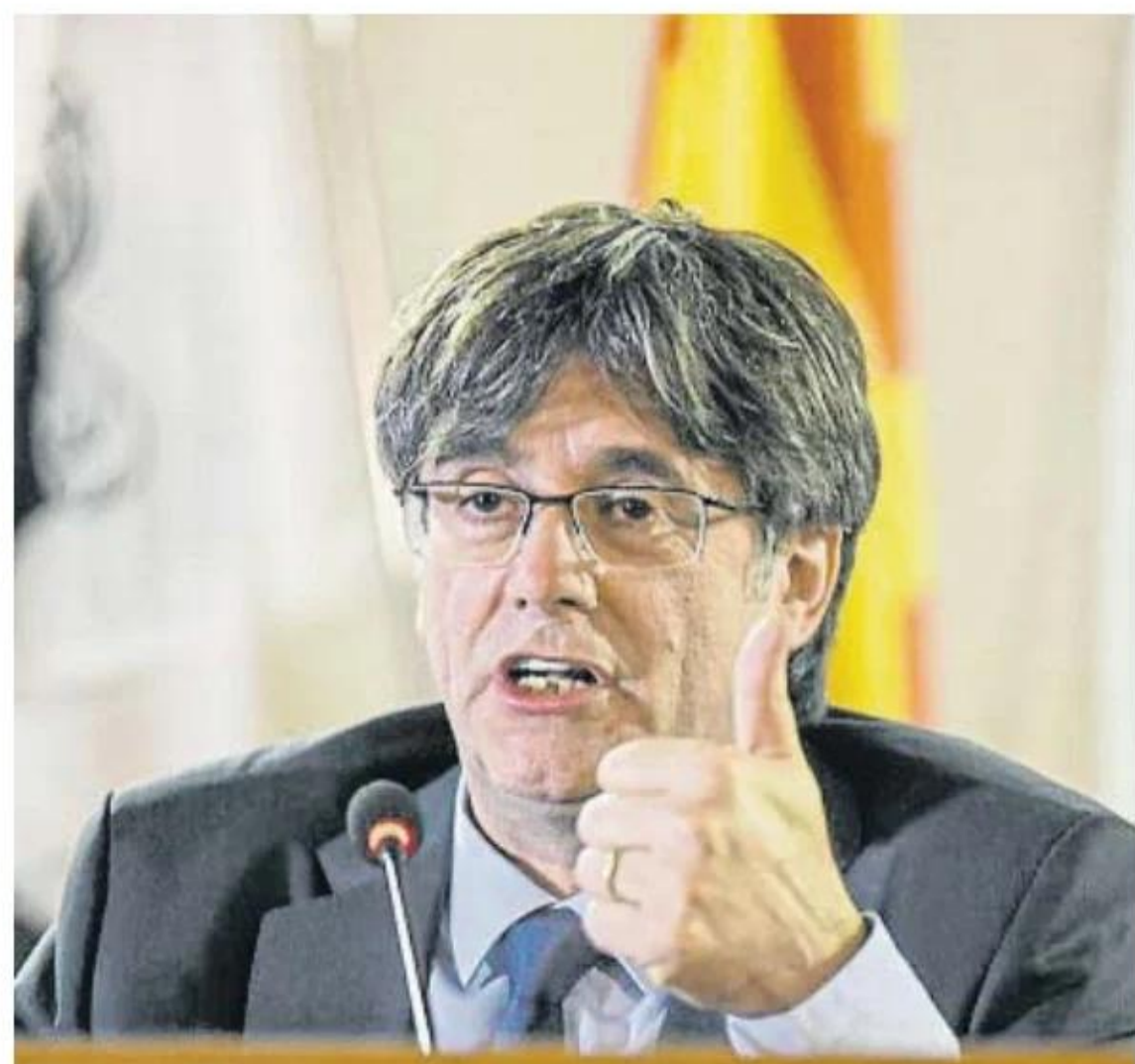
Carles Puigdemont, en una imagen reciente