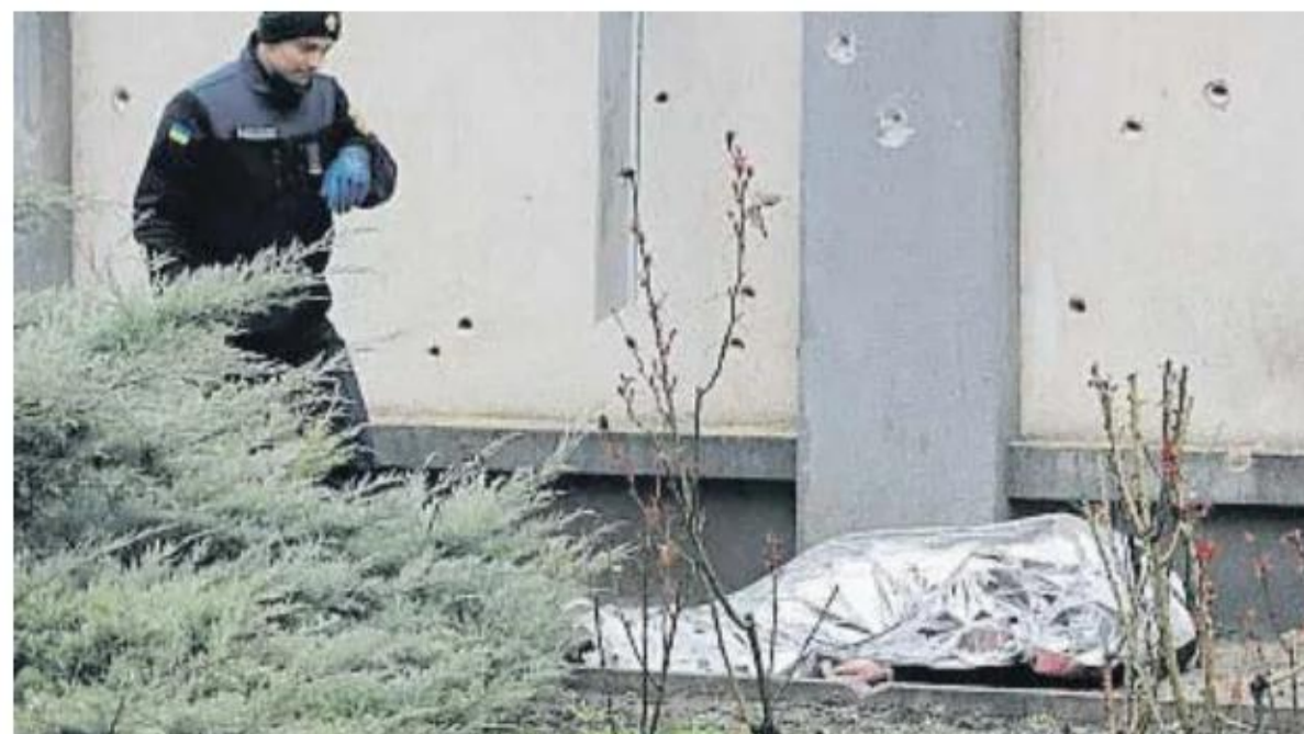
Una de las víctimas del ataque

lancias y vehículos de bomberos. El ataque, uno de los más mortíferos perpetrados por Rusia contra Odesa, se produce en el primer día de votaciones de las presidenciales rusas. “Putin envía al mundo un mensaje claro en el día en que comienza el procedimiento para su redesignación dictatorial”, afirmó Mijáilo Podoliak, asesor presidencial ucraniano.●