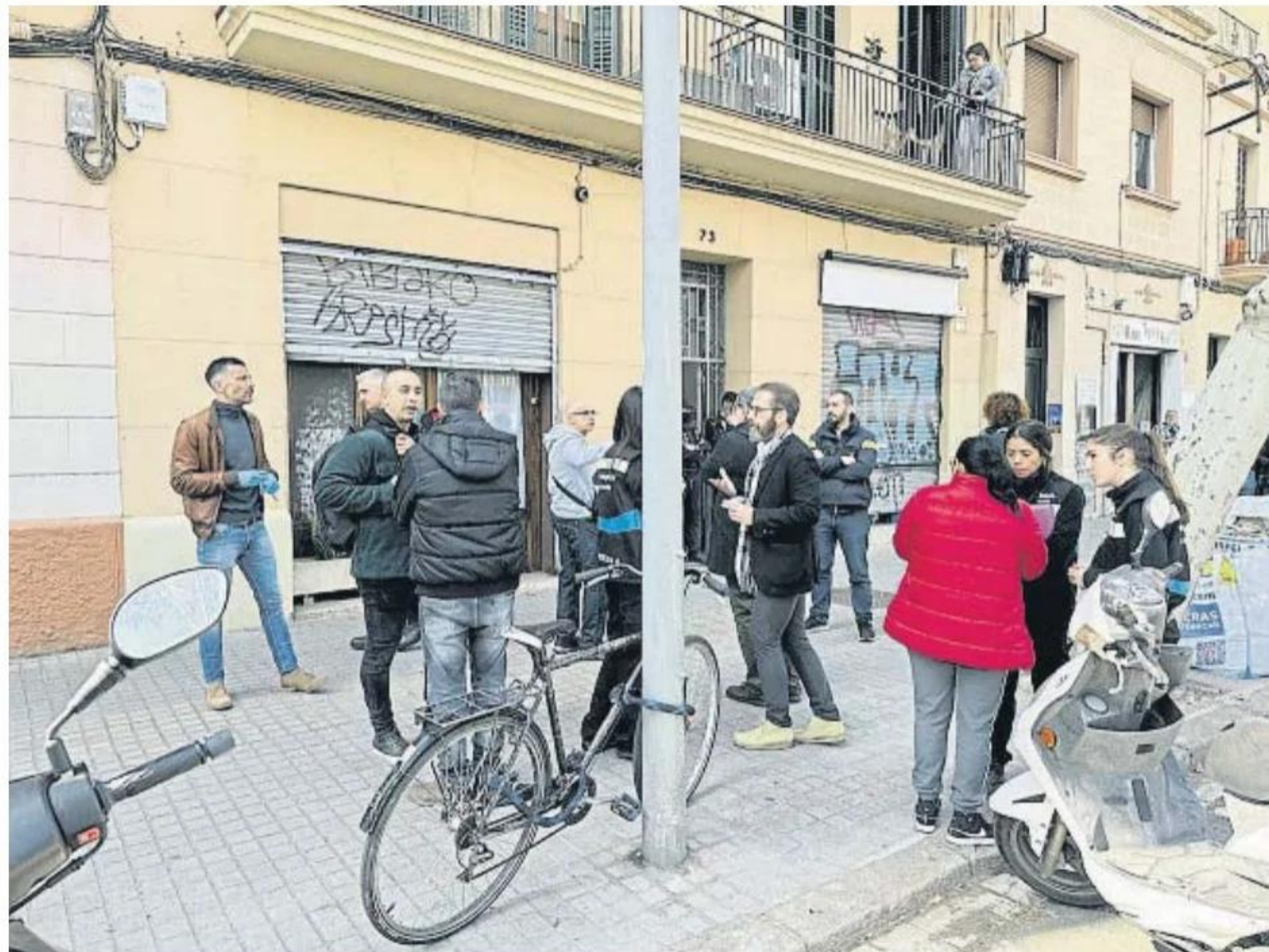
Mossos de homicidios y de la científica, a las puertas del domicilio de la familia del Poblenou, ayer

el cuidado de unos padres que cada vez estaban peor. Y él mismo con una situación mental compleja que le había llevado a sufrir episodios severos de depresión. Un cóctel emocionalmente terrible que pudo derivar en varios escenarios en los que trabajan los investigadores. En-