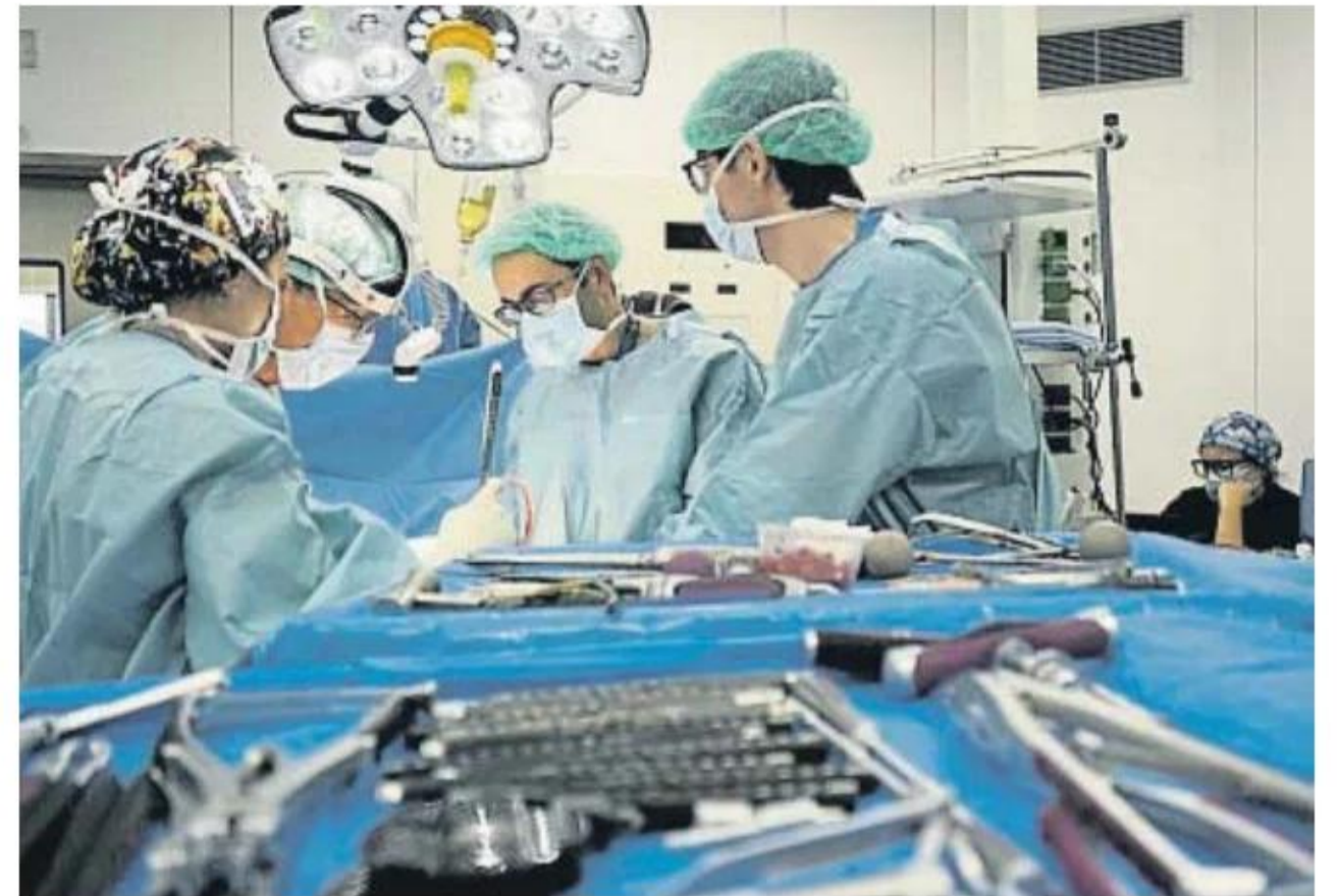
Parte del equipo, durante una operación de columna vertebral

Causa estupor que a la misma clase política que ahora se acuchilla a cuenta del novio de Ayuso le resbale el drama de las residencias. No hay explicaciones, y menos una comisión de investigación. Tampoco el fiscal mueve un dedo. Conclusión: a nadie le importan un pito los mayores. Ni antes ni ahora. Solo hay promesas incumplidas y una única condena a que permanezcan callados y meados en algún rincón de un geriátrico hasta que otro virus ponga la corona sobre su lecho.