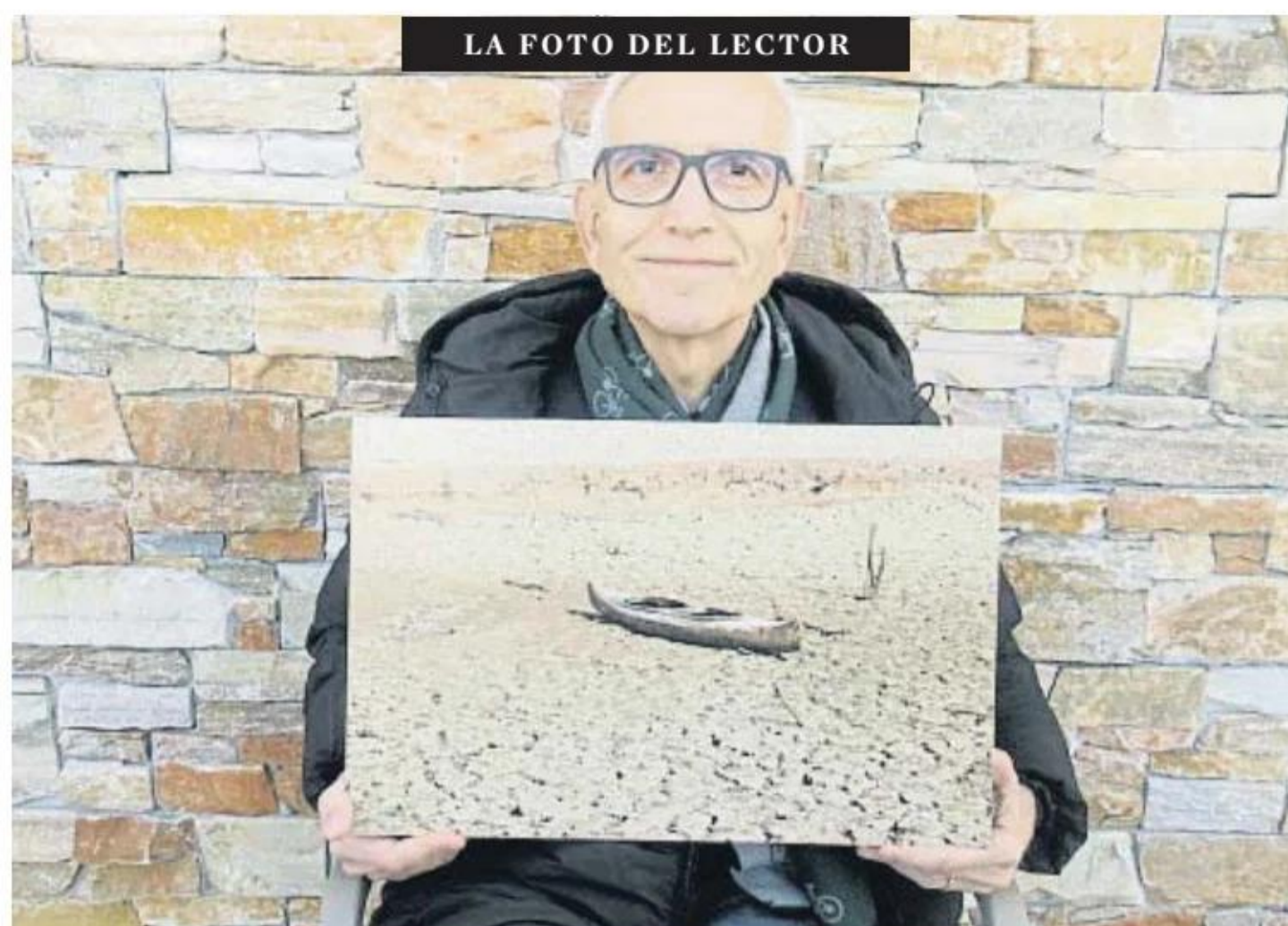
LA FOTO DEL LECTOR

S'han conegut les conclusions d'experts per millorar les puntuacions de l'últim informe PISA, resumides en el fet que calen més recursos. Comparteix algunes reflexions escoltades a la consulta com a metgessa de família, on atendre la desesperació de docents i l'an-