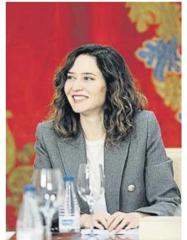
Isabel Díaz Ayuso