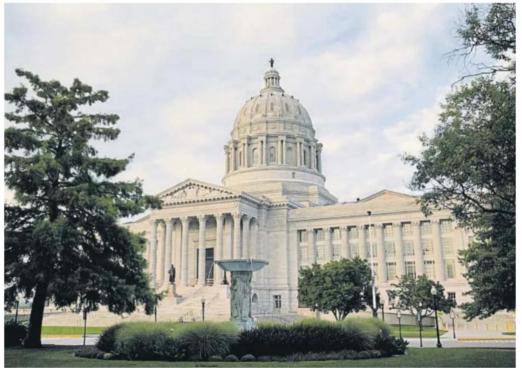
El Capitolio de Misuri, sede del legislativo, en Jefferson City

Los activistas advierten que la ley facilita la coerción reproductiva, término que significa que otra persona controla la voluntad reproductiva autónoma de una mujer. Entre los ejem-